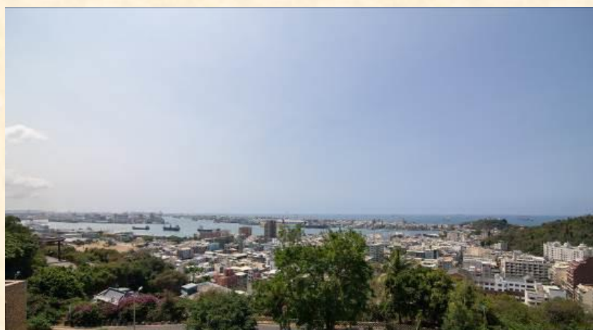
▲ 站上觀景平臺可以一覽山下及海景風光